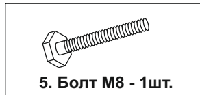
5. Болт М8 - 1шт.