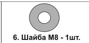
6. Шайба М8 - 1шт.