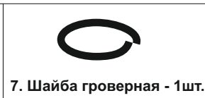
7. Шайба гроверная - 1шт.