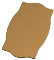
1. Столешница - 1 шт. (Берже 2 - квадрат)