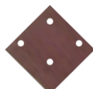
4. Крепёжный эл-т 4 шт.