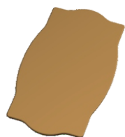
1. Столешница - 1 шт. (Берже 2 - квадрат)